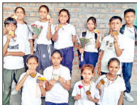
बराड़ा। प्रतियोगिता में विजेता विद्यार्थी।