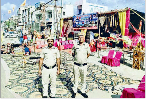
करनाल। कांवड़ियों की सुरक्षा में तैनात पुलिस।

प्रशासन का निर्देश धार्मिक आस्था के नाम पर नहीं होगी अनुशासनहीनता