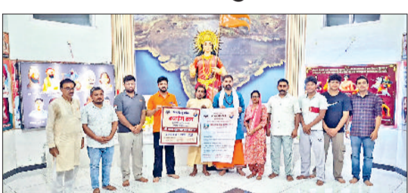
मुलाना। यात्रा को पोस्टर जारी करते हुए पदाधिकारी।