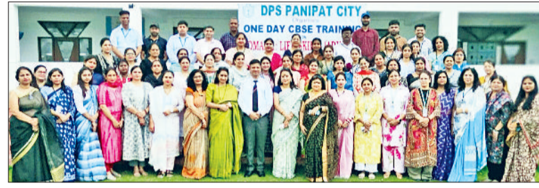
पानीपत। दिल्ली पब्लिक स्कूल पानीपत सिटी में क्षमता निर्माण कार्यशाला में शिरकत करते हुए टीचर्स।

प्रस्तुत किया गया। उन्होंने बताया कि शिक्षकों को जीवन कौशल की कार्यशाला देने का मुख्य उद्देश्य छात्रों के जीवन में आवश्यक कौशल विकसित करने के लिए आवश्यक ज्ञान और कौशल प्रदान करना है ताकि वे 21वीं सदी की चुनौतियों का सामना आत्मविश्वास और कुशलता से कर सकें। उन्होंने बताया कि रचनात्मकता,