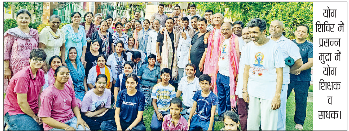
योग शिविर में प्रसन्न मुद्रा में योग शिक्षक व साधक।