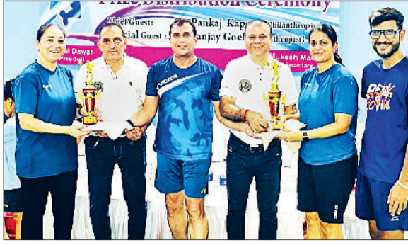
पानीपत क्लब में बैडमिंटन टूर्नामेंट के विजेताओं को पुरस्कृत करते हुए अतिथिगण।