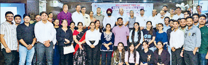
पानीपत। आईसीएआई द्वारा विश्व युवा कौशल दिवस कार्यक्रम में शिरकत करते हुए अतिथिगण।